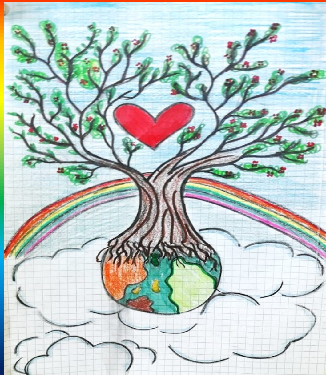
DISEGNI A CURA DI ADAMU PISAM E LEO ANTONELLA DELLA CLASSE 1 ^ C IAMI